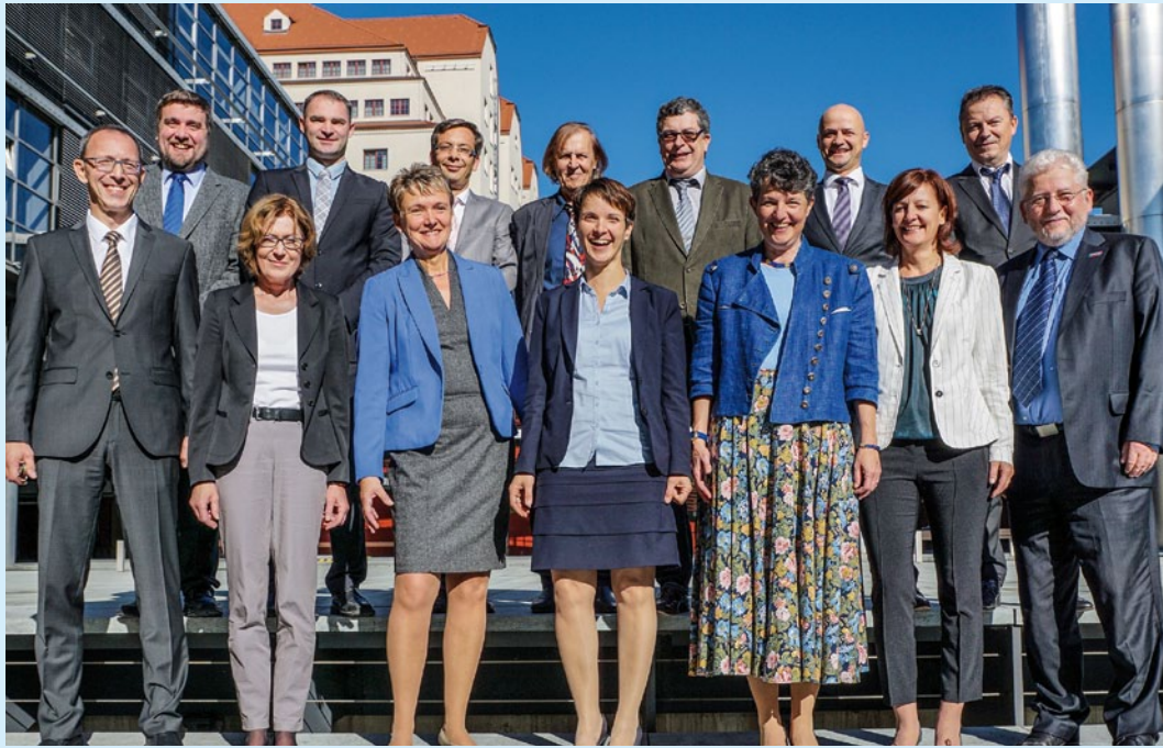
Ihre Abgeordneten der AfD-Fraktion im Sächsischen Landtag